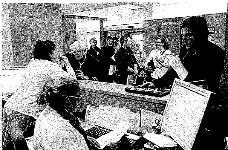
Pacientes en el CAP Rambla