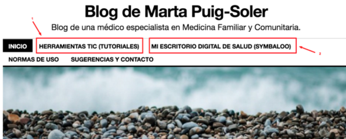
Figura 1: Pàgina d'inici del blog